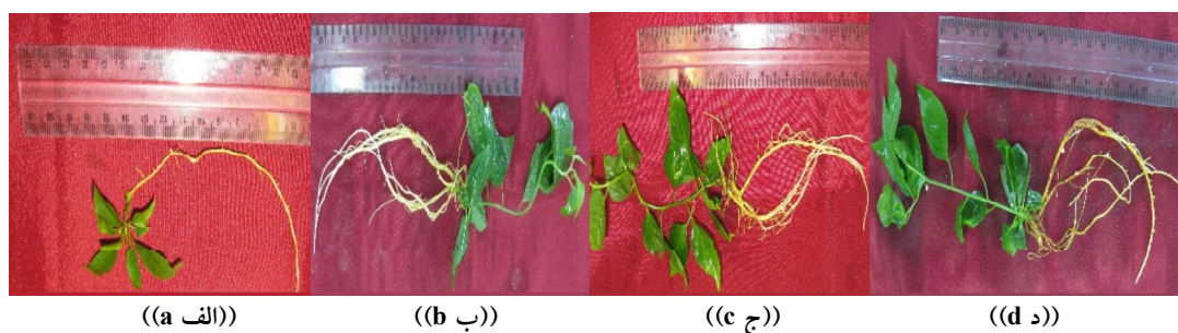
شکل ۲- اثر غلظت‌های NAA در محیط DKW بر تعداد ریشه Myrobalan 29C (الف) ۰ میلی‌گرم در لیتر، (ب) ۱ میلی‌گرم در لیتر، (ج) ۲ میلی‌گرم در لیتر و (د) ۳ میلی‌گرم در لیتر.