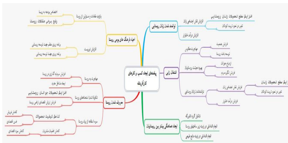
شکل ۲- پیامدهای ایجاد کسب و کار کارآفرینانه روستایی در روستای زردویی

پس از استخراج پیامدهای شناسایی شده از لایه‌های ذهنی مخاطبان، موارد در قالب یک نمودار در اختیار مشارکت کنندگان قرار گرفت و از آن‌ها خواسته شد که در مورد پیامدها به بحث بپردازند و اگر خواهان تغییر و یا جا به جایی در نمودار هستند، دلایل خود را