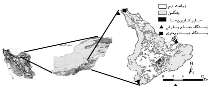
شکل ۱- موقعیت حوزه، ایستگاه‌های هواشناسی و انواع کاربری اراضی در حوزه آب‌خیز چهل‌چای استان گلستان.

معرفی منطقه مورد مطالعه: حوزه آب‌خیز چهل‌چای در جنوب شرق استان گلستان، با مساحتی حدود ۲۵ هزار هکتار در بین طول‌های جغرافیایی شرقی ۵۵ درجه و ۲۲ دقیقه و ۳۰ ثانیه تا ۵۵ درجه و ۳۷ دقیقه و ۳۰ ثانیه و عرض‌های جغرافیایی شمالی ۳۶ درجه و ۵۷ دقیقه و ۳۰ ثانیه تا ۵۵ درجه و ۲۲ دقیقه و ۳۰ ثانیه ۳۷ درجه و ۱۵ دقیقه قرار گرفته است. شیب متوسط حوزه حدود ۳۷ درصد و دارای حداقل و حداکثر ارتفاع حدود ۱۹۰ و ۲۵۵۵ متر از سطح دریا است. شکل ۱ موقعیت جغرافیایی حوزه چهل‌چای و ایستگاه‌های هیدرومتری و هواشناسی و کاربری‌های اراضی در محدوده مورد مطالعه را نشان می‌دهد. بارش متوسط حوزه در ایستگاه لزوره طی سال‌های ۲۰۰۹-۲۰۰۱، ۸۴۸ میلی‌متر و میانگین درجه حرارت ماهانه آن ۱۸ درجه سانتی‌گراد است. مهم‌ترین شکل فرسایش در حوزه سطحی و شیاری است و انواع دیگر فرسایش مانند خندق و زمین‌لغزش در بعضی نقاط زیرحوزه‌ها به صورت محدود دیده می‌شود (مهندسین مشاور رواناب، ۲۰۰۵).