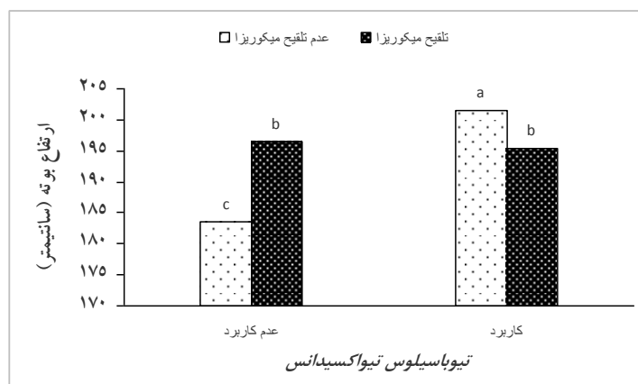
شکل ۲- تأثیر کاربرد همزمان قارچ میکوریزا و باکتری تیوباسیلوس تیواکسیدانس بر ارتفاع بوته ذرت.