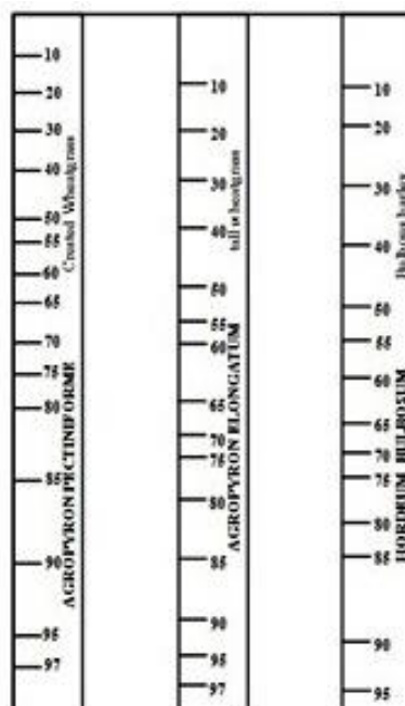
شکل ۳ - مقیاس بهره‌برداری تهیه شده برای سه گونه Agropyron pectiniforme ، Agropyron elongatum و Hordeum bulbosum