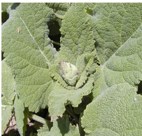
شکل ۳- ابتدای ظهور گل آذین.

کروماتوگرام اسانس گیاه در شکل ۶ آمده است. روستائیان (۱۹۸۲)، برای اولین بار مهم‌ترین ترکیب‌های این گونه را لینالیل استات، لینالول و آلفا ترپینئول گزارش نمودند. میرزا و همکاران (۲۰۰۳) مهم‌ترین ترکیبات اسانس گونه S. mirzayanii را لینالول (۱۹ درصد)، لینالیل استات (۱۲/۹ درصد) و ۱ و ۸ سینئول گزارش نمودند. در اسانس S. limbata جرماکرن D (۲۵/۷ درصد)، لینالیل استات (۱۶/۱ درصد) و لینالول (۱۶/۱ درصد) ترکیب‌های مهم بوده‌اند (باهرنیک و میرزا، ۲۰۰۵).