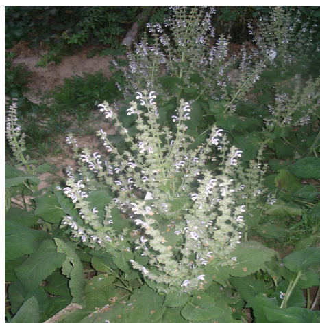
شکل ۵- مرحله گل دهی گیاه مریم گلی کبیر.