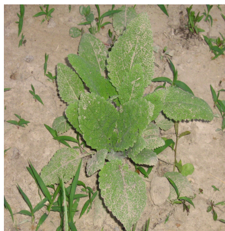
شکل ۲- بوته‌ها در مرحله رزت.