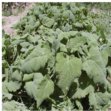
شکل ۴- بوته‌ها در مرحله ساقه‌دهی.