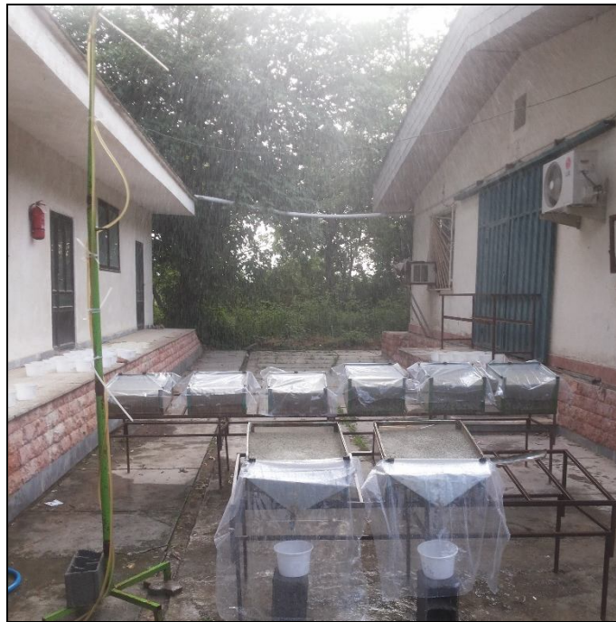
شکل ۱- نمایی از فرآیند شبیه‌سازی باران روی کرت‌های آزمایش.

حین اجرای آزمایش، علاوه بر ثبت زمان شروع رواناب و خاتمه آن پس قطع بارندگی، میزان رواناب و رسوب خروجی از کرت‌ها پس از شروع رواناب هر دو دقیقه یکبار (۳۱) و تا آخر آزمایش اندازه‌گیری شد. هر یک از نمونه‌های برداشترشده در بازه‌های زمانی دو دقیقه‌ای از ابتدای شروع رواناب در اولین کرت دارای رواناب تا انتهای آزمایش، با شماره‌های یک تا ۳۹ (شکل ۲) نام‌گذاری شدند. پس از اتمام فرآیند شبیه‌سازی باران، حجم رواناب در بازه‌های زمانی دو دقیقه و هم‌چنین کل بازه زمانی پس از شروع رواناب تا خاتمه بارندگی (۳۴) بر حسب میلی‌لیتر اندازه‌گیری شد. به‌منظور اندازه‌گیری میزان هدررفت خاک و غلظت رسوب در هر یک از تیمارها نیز از روش برجای‌گذاری و توزین رسوب باقی‌مانده به‌ترتیب بر حسب گرم و گرم بر لیتر پس از خشک کردن در آون با دمای ۱۰۵ درجه‌ی سانتی‌گراد به‌مدت ۲۴ ساعت استفاده شد (۳۵).