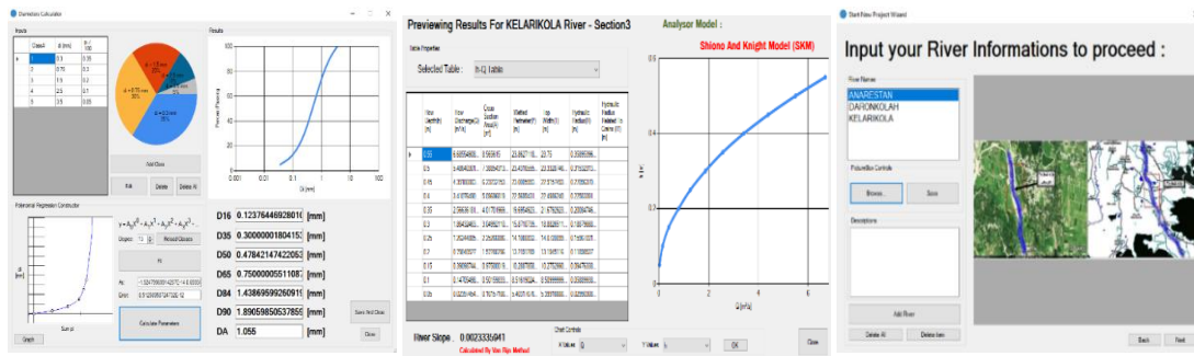
شکل ۱- محیط کاربری نرم افزار STE. Figure 1. User form of STE software.