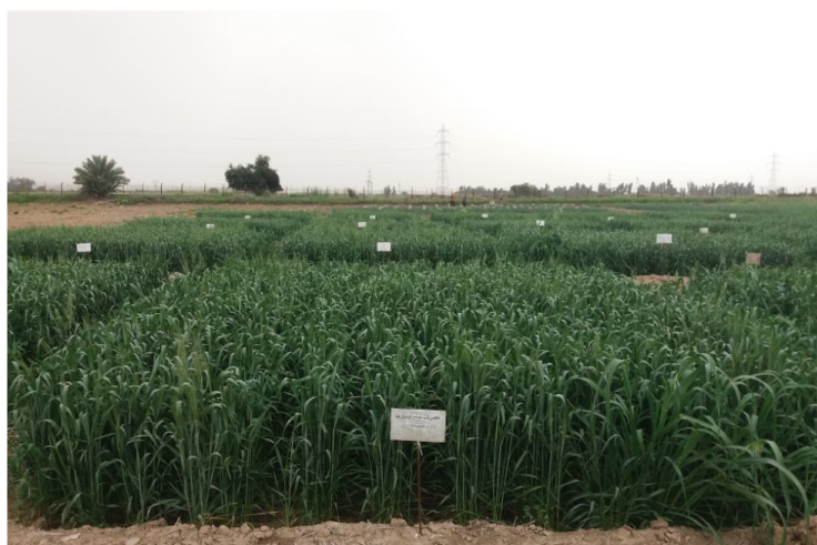
شکل ۱- مزرعه گندم.